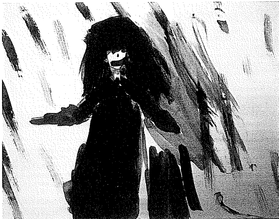
«Takes time to forget», anonyme.